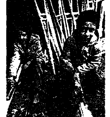
الوزير جيري هو لحظة وصوله الى اجتماع وزراء خارجية المجموعة الأوروبية

اعلنت اس مصلح حكومية افغانانية ان رئيس الوزراء الافغانتي محمد حسن شكري استقال من منصبه بينما تولي مجلس عسكري اعل مؤلف من ٢٠ شخصا الحكم في افغانستان. وكان السيد شكري (٦٣ عاما) اكبر مسؤول حكومي غير عضو في حزب الشعب الديمقراطي الحاكم الذي يتزعمه الرئيس نجيب الله. ولم يذكر اسم السيد شكري في قائمة اعضاء المجلس العسكري الجديد التي اعلنت رسميا ليلة امس الاول. وجمع اعضاء المجلس العسكري - باستثناء ذلك الرئيس عبد الرحيم شافق - اعضاء حزبيي الحكم والحزب الديمقراطي الحاكم الذي اعلنت رسميا ليلة امس الاول. وكانت هذه التصديلات عقب انسحاب اخر القوات السوفياتية من افغانستان يوم الاربعة الماضي. وكان من المتوقع على نطاق واسع استقالة السيد شكري بعد تسعة اشهر من توليه منصبه. ولكن الاسباب لم تتضح قورا. وقال مصدر حكومي انه ذكر سوء صحته كسبب. ولكن مصدر اخر قال ان الرئيس نجيب الله والسيد شكري اتفقا على ضرورة ان يرأس الرئيس الافغانتي مجلس الوزراء اثناء حلة طوارئ. اعلنت يوم الاحد. وقال مصدر حكومي انه ذكر سوء صحته كسبب. ولكن مصدر اخر قال ان الرئيس نجيب الله والسيد شكري اتفقا على ضرورة ان يرأس الرئيس الافغانتي مجلس الوزراء اثناء حلة طوارئ. اعلنت يوم الاحد. وقال مصدر حكومي انه ذكر سوء صحته كسبب. ولكن مصدر اخر قال ان الرئيس نجيب الله والسيد شكري اتفقا على ضرورة ان يرأس الرئيس الافغانتي مجلس الوزراء اثناء حلة طوارئ. اعلنت يوم الاحد. وقال مصدر حكومي انه ذكر سوء صحته كسبب. ولكن مصدر اخر قال ان الرئيس نجيب الله والسيد شكري اتفقا على ضرورة ان يرأس الرئيس الافغانتي مجلس الوزراء اثناء حلة طوارئ. اعلنت يوم الاحد.